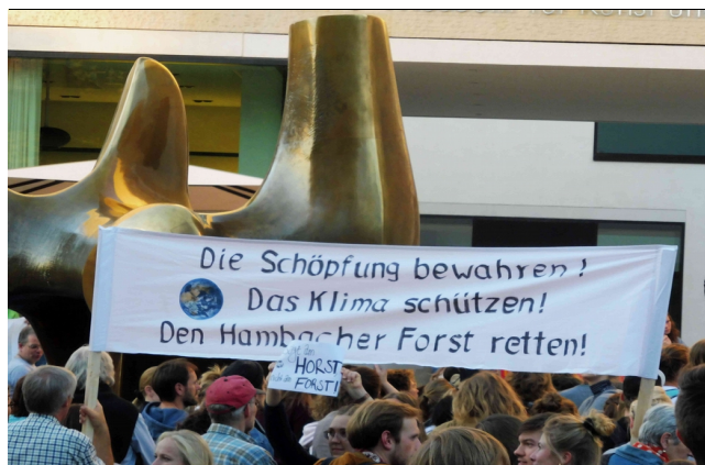
Transparent der Klimainitiative Münster bei der Demonstration für den Erhalt des Hambacher Waldes am 26.9. in Münster